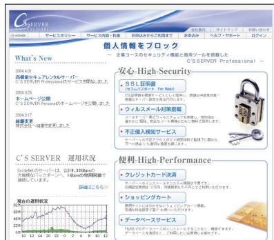
C'S SERVER Professional のトップページ